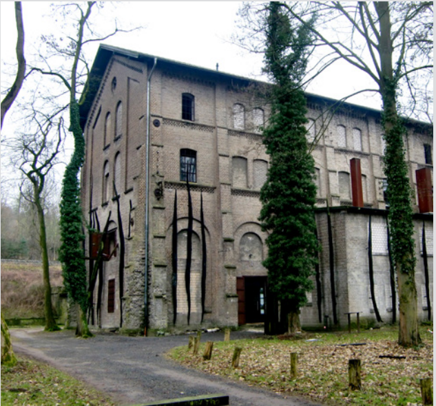
Ein ehemaliges Pumpwerk als Arbeitserziehungs- und Kriegsgefangenenlager: der Augustaschacht bei Hasbergen (Landkreis Osnabrück).