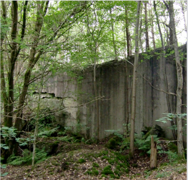
Unterkunft im Öltank: Ruine eines verbunkerten Treibstofflagers bei Schwane- wede (Landkreis Osterholz), das als größtes Außenlager des KZ Neuengamme Verwendung fand.