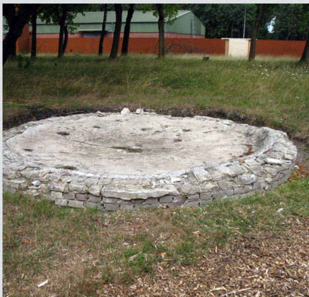
Erholung für die Täter: Reste eines Springbrunnens im Quartier der Wachmannschaften des Konzentrationslagers Esterwegen (Emsland).