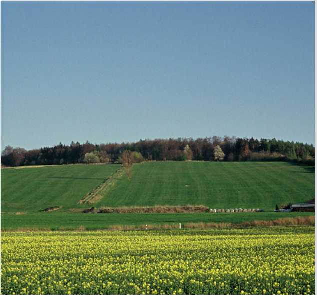
Von Albert Speer gestaltete „Natur“: Der Bückeberg bei Hameln. Hier fanden von 1933 bis 1937 die „Reichserntedankfeste“ mit bis zu einer Million Teilnehmenden statt.