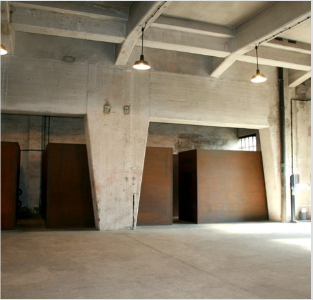
Unter einer Hochstraße: Räume des ehemaligen KZ-Außenlagers Salzgitter-Drütte auf dem Werksgelände der Salzgitter AG.