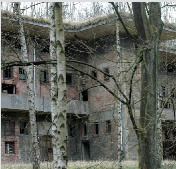
Großanlagen der Rüstungsindustrie: Ruine eines Gebäudes, in dem Nitrit produziert wurde, auf dem Gelände der früheren Pulverfabrik Liebenau bei Nienburg/Weser. • Martin Guse, Dokumentationsstelle Pulverfabrik Liebenau